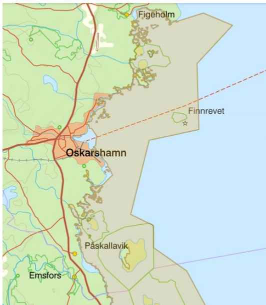
Figur 1. Ett av Länsstyrelsens förslag på nya Natura 2000-områden, Oskarshamns- och Mönsteråskusten , vars nordliga del ligger i Oskarshamns kommun.

Länsstyrelsen i Kalmar län har tagit fram förslag på fem nya eller utvidgade Natura 2000-områden, varav ett - Oskarshamns- och Mönsteråskusten - ligger inom Oskarshamns kommun, Figur 1. Förslaget på nya Natura 2000-områden är nu ute på samråd, och Oskarshamns kommun har beretts möjlighet att yttra sig. Efter avslutat samråd, kommer Länsstyrelsen göra en sammanställning av inkomna synpunkter som underlag för kommande beslut av regeringen om vilka områden som ska ingå i Natura 2000-nätverket. Förslaget redovisas i sin helhet på Länsstyrelsens hemsida: LSTH WebbGIS natura 2000 – WebMap (lansstyrelsen.se) .