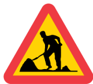
A20 Varning för vägarbete