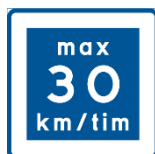
E11 Rekommenderad lägre hastighet