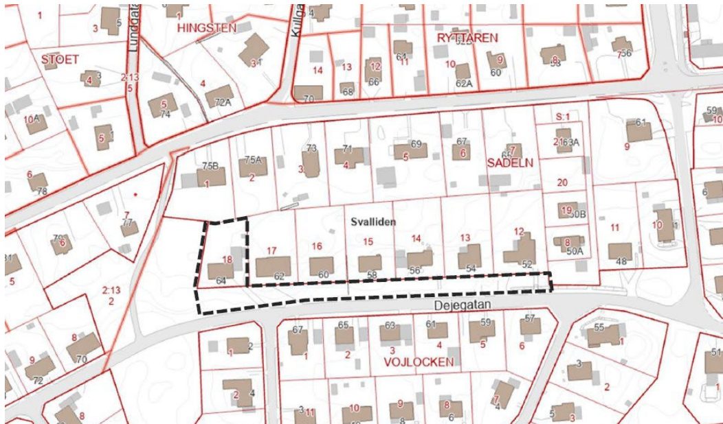
Planområdets ungefärliga avgränsning markerat i svart.