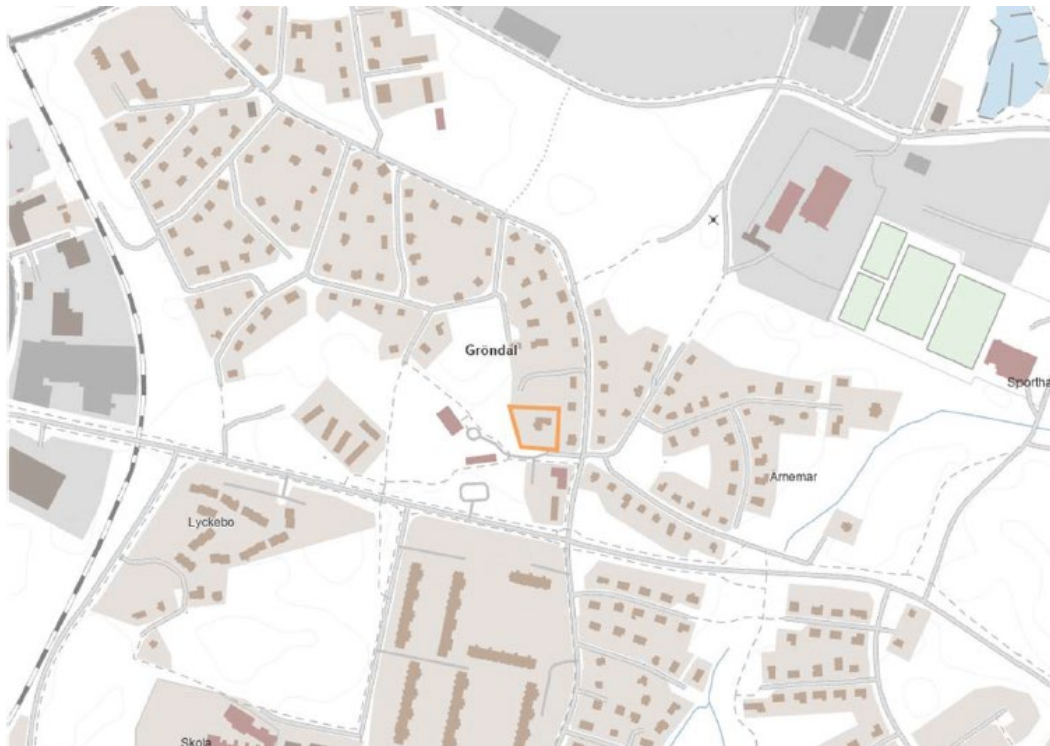
Översiktskarta för planområdet.