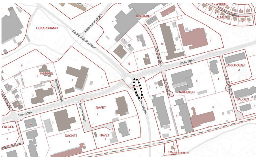
Översiktskarta, planområdets ungefärliga avgränsning markerat med svart streckad linje.