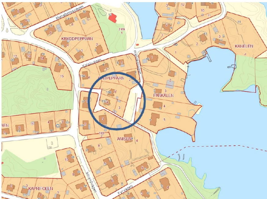
Figur 1 Översiktskarta för planområdet.