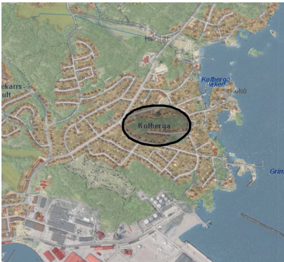
Översiktskarta med planområdet markerat.